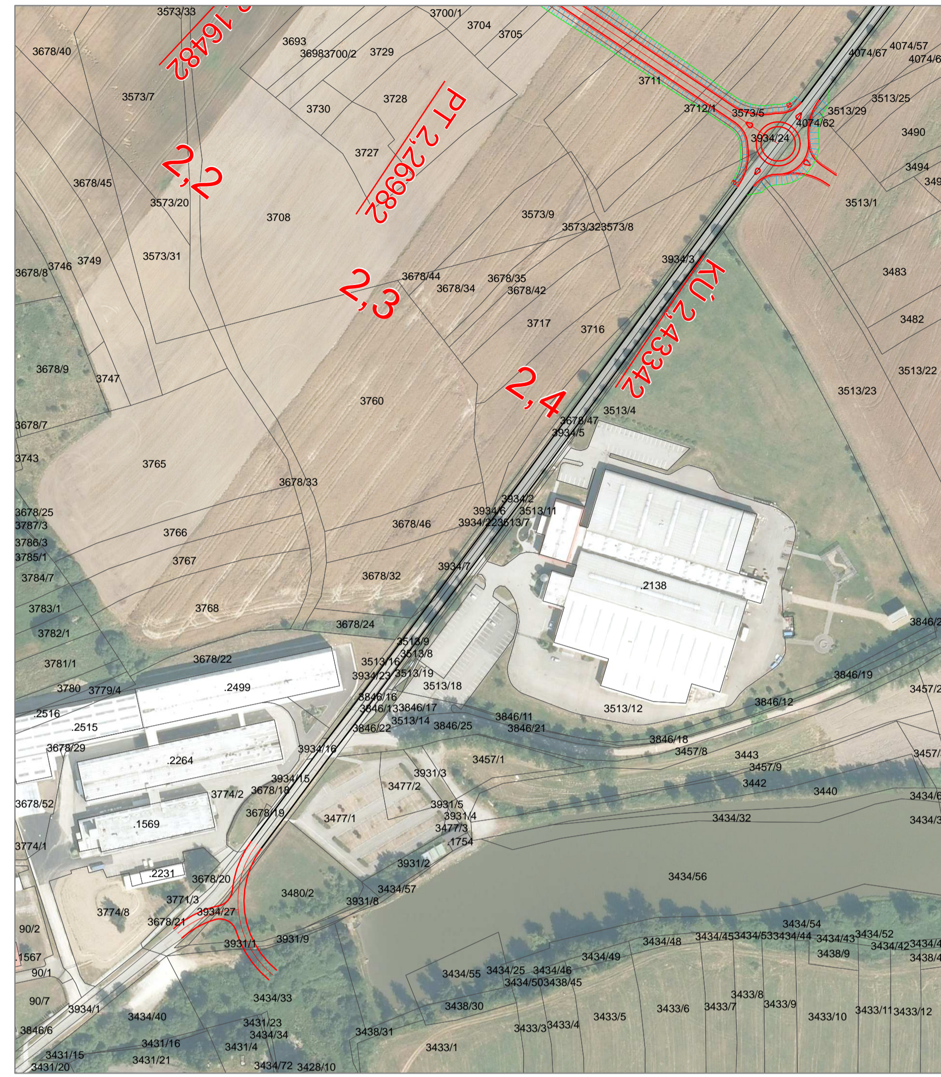
KŘIŽOVATKY SE SILNICÍ III/157